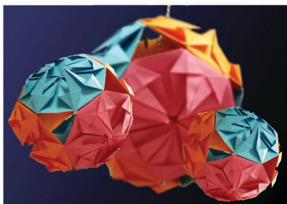
"Pliages" (œuvre des enfants du CLAS)

Merci de prendre contact pour étudier l'aménagement de la reprise de votre échange et/ou votre inscription.